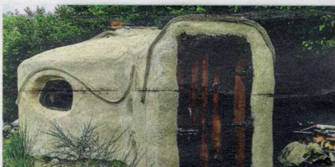
La première kerterre des 'Loges de la nature' est entièrement conçue en matériaux natu...

Lieu Dit Fayot, 03250 Saint-Nicolas-des-Biefs. Pour deux personnes : 85 euros la nuit avec petit déjeuner. Possibilité de table d'hôte. www.les-logesdelanature.com - 06 10 36 18 90.